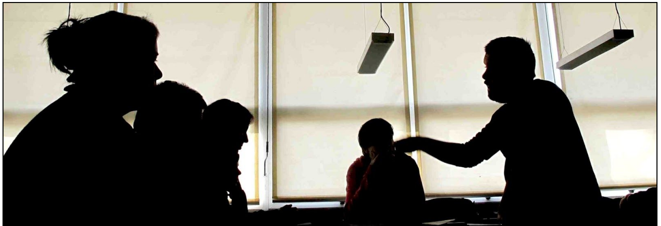
Dando clase en la Universidad Nacional de Lanús [2011]

Jefe de Trabajos Prácticos. 2006 Cátedra de Lenguaje Multimedial I. Carrera de Diseño Multimedia. Departamento de Multimedia. Facultad de Bellas Artes. Universidad Nacional de La Plata.