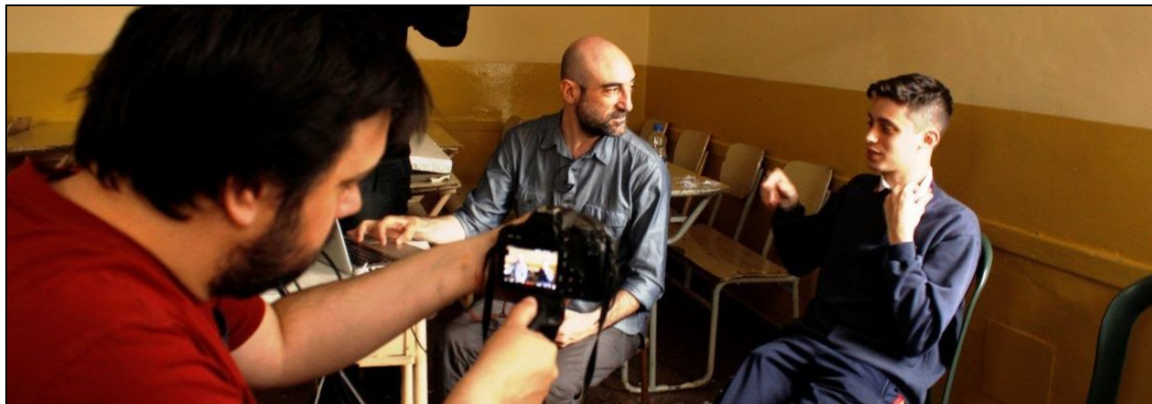
Rodaje «Acá y Acullá» [2015]